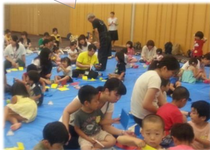
研究大会ワークショップ

多様な教育機関の方々や他県の先生方と語り合い、どこかでひとつに“つながっている”ことが感じられました。講師の先生のお話でグループ協議の内容が深まり、大変勉強になりました。